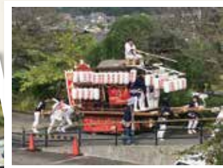
登り坂はたいへん!