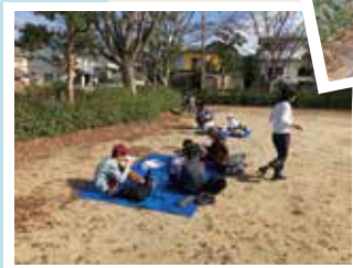
昼食のカレー、美味しくいただきました!

日時: 【前祭】10月7日(土) 13:00~18:30 【本祭】10月8日(日)9:00~12:00 共催:加賀田フェスティバル実行委員会/ 加賀田中学校区青少年健全育成会