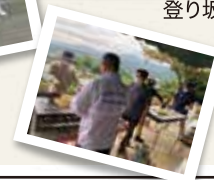
焼きそばも 振る舞いました!