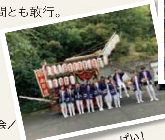
中学生達も元気いっぱい!