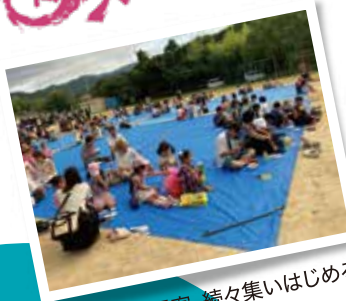
観客、続々集いはじめる!