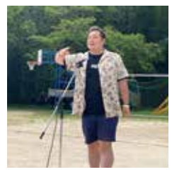
監督、サプライズ登場!