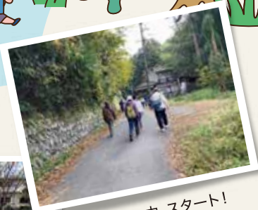
秋晴れの中、スタート!