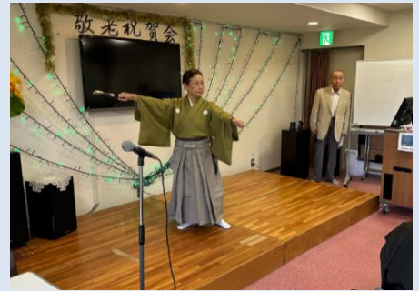
詩舞 新涼書を読む

全員が笑顔ですごせるこの雰囲気、そして語らい、これがひと時の安らぎに通じ、健康で文化的な生活に繋がることを願ってむつみ会は活動を進めて参ります。