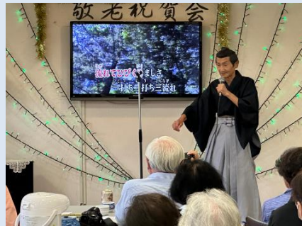
浪曲演歌 俵屋玄蕃