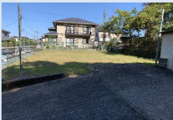
草刈り作業後の旧ガスタンク空地

これまで、各家庭への来客やリフォーム等で駐車場が必要になった際、青葉台会館の駐車場を臨時で貸し出すこととしてきました。