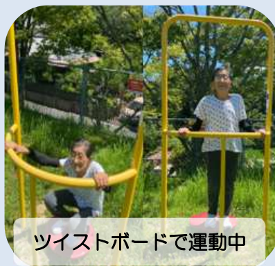
ツイストボードで運動中