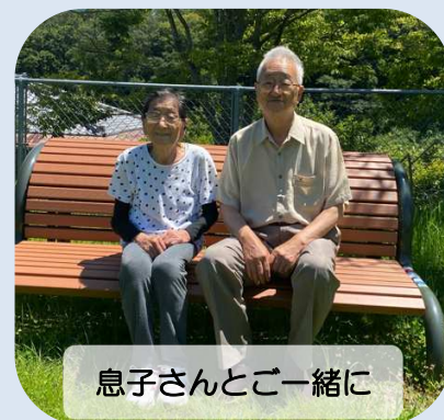
息子さんと一緒に